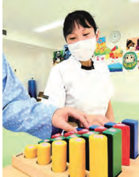
リハビリテーション科 Oさん

1年目を振り返り、感じたことは、作業療法士はやりがいのある仕事だということです。国家試験の勉強中は知識を身につけることに精一杯で、実際のリハビリを具体的に想像することは難しく感じていました。しかし、臨床現場で患者さんと関わる中で、学んだ知識が評価や介入につながっていくことを実感しました。介入していく中で、少しずつ回復していく姿を見ることや、感謝の言葉をいただくことが日々の励みとなっています。また、先輩方から日々多くのことを学び、相談しながら臨床に取り組んでいる点も、大きな支えとなっています。